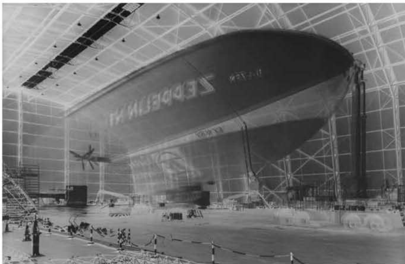
Vera Lutter, Zeppelin, Friedrichshafen, V: August 23-27, 1999, 142 x 210 cm.

dove rimangono per tempi di posa che variano da alcuni minuti a mesi interi a seconda delle dimensioni del foro stenopeico e delle condizioni della luce.