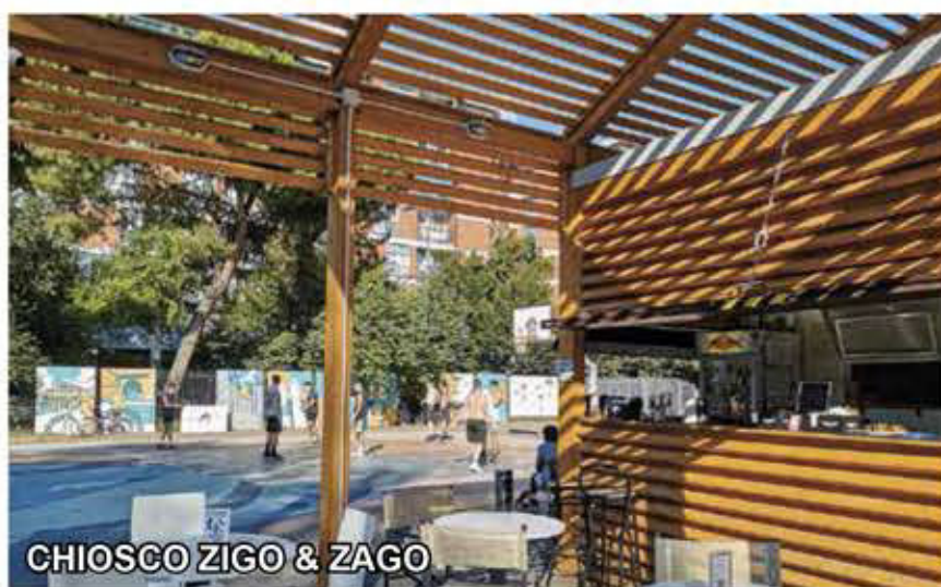
CHIOSCO ZIGO & ZAGO