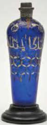
Fiala di vetro. Siria, XIII secolo. Vetro blu decorato a smalti policromi e oro, cm 17,5 x 7,8 Provenienza: collezione Pelagio Palagi Bologna, Museo Civico Medievale, inv. 1395