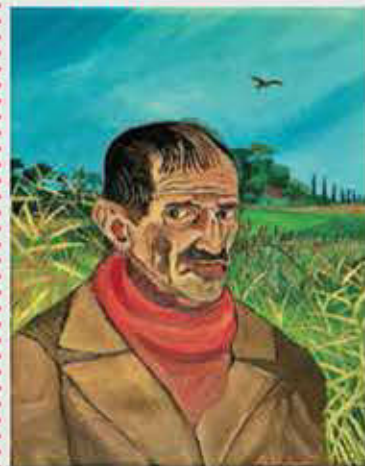
Antonio Ligabue, Autoritratto con sciarpa rossa, s.d., (1952-1962) . Olio su tavola di faesite, cm 91x74,5. Collezione privata