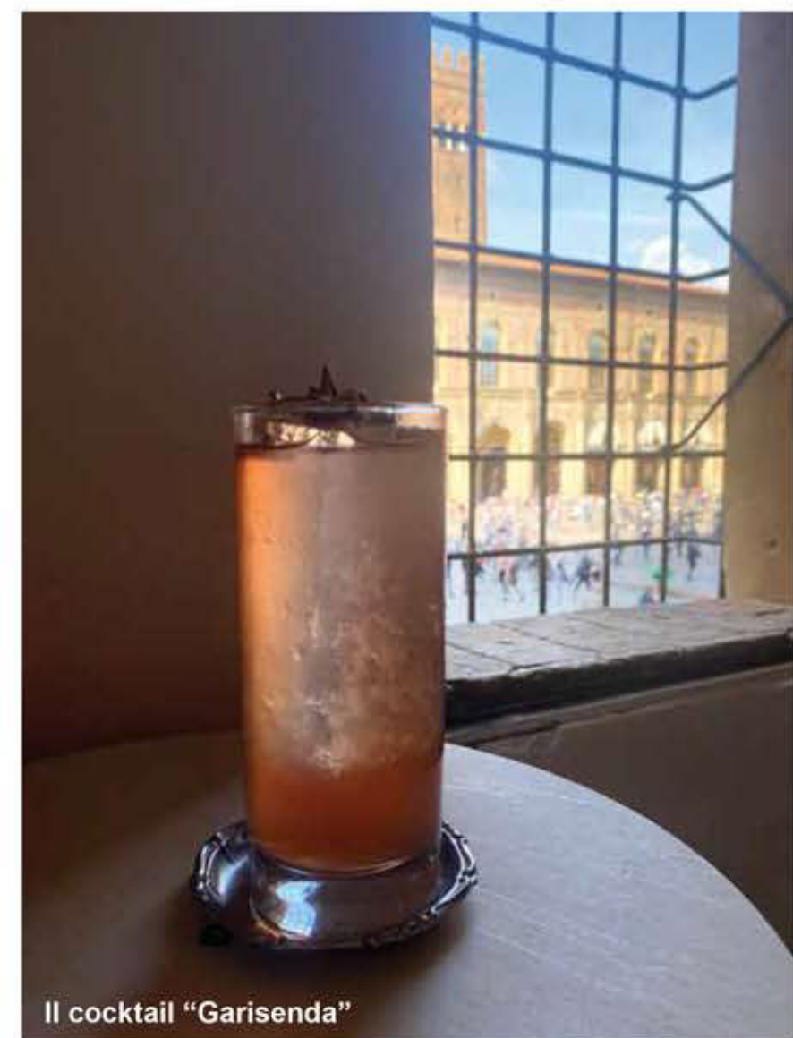
Il cocktail "Garisenda"