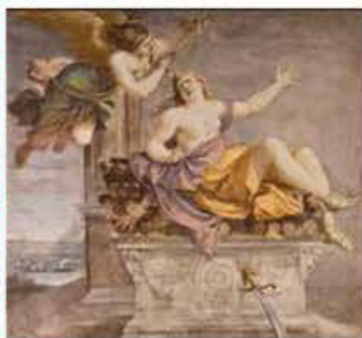
Annibale Carracci (Bologna, 1560 - Roma, 1609),

Morte di Didone, 1592 Affresco riportato su tela, cm 121 x 124 Firmato ANN. CARRACCIUS PING. Provenienza: Bologna, Palazzo Lucchini (poi Angelelli, poi Zambecari) San Martino di Soverzano, collezione Paletti